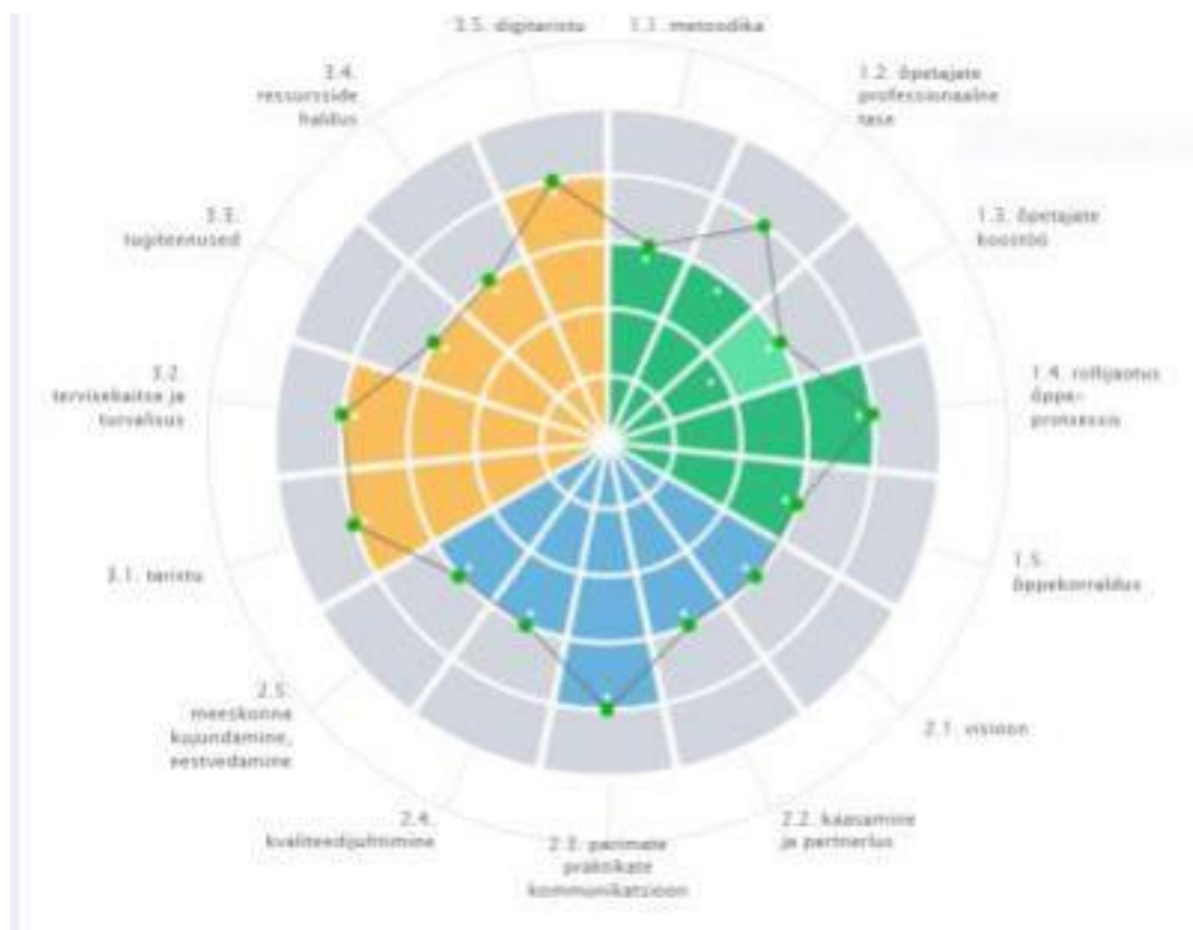
Joonis 2 Toetavate arendusmeetmete rakendamise tulemusena saavutatakse 2025. aastaks järgmine seisund. Arengustrateegia kompass 2022-2025